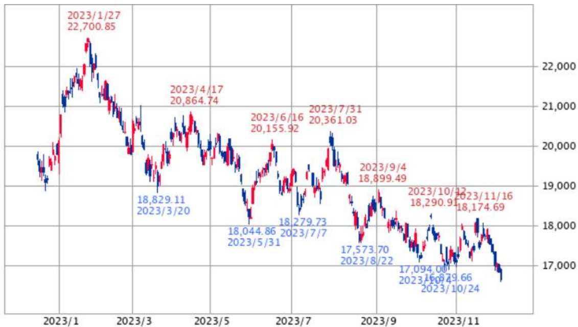
【香港ハンセン指数:1年】