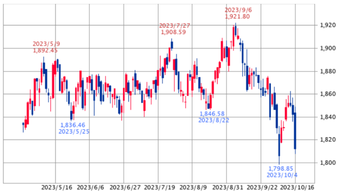
【東証リート指数:6ヵ月】