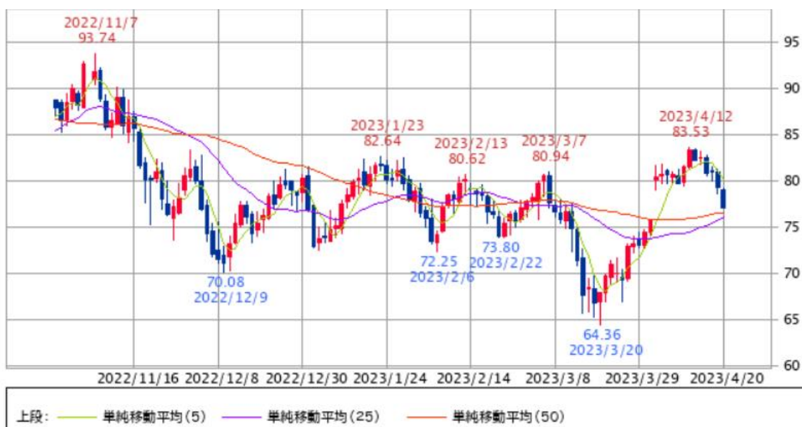
【WTI 原油:6 ヶ月】