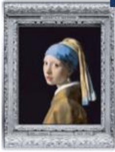
Girl with a Pearl Earring 250€ 1/2 Kg Silver Coin Proof quality yeardate 2021