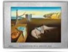
The Persistence of Memory 250€ 1/2kg silver coin Proof quality yeardate 2021