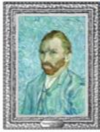
Van Gogh 1/2 kg silver coin Proof quality yeardate 2020