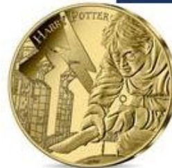
Harry Potter Quidditch - 250€ Gold Coin Yeardate 2021