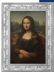
Monna Lisa 1/2 Kg Silver coin Proof quality yeardate 2019