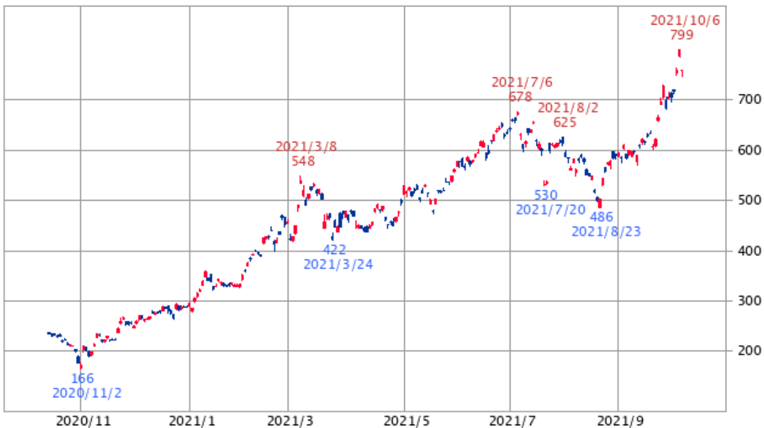
【原油先物ダブル・ブル(2038) : 1年】