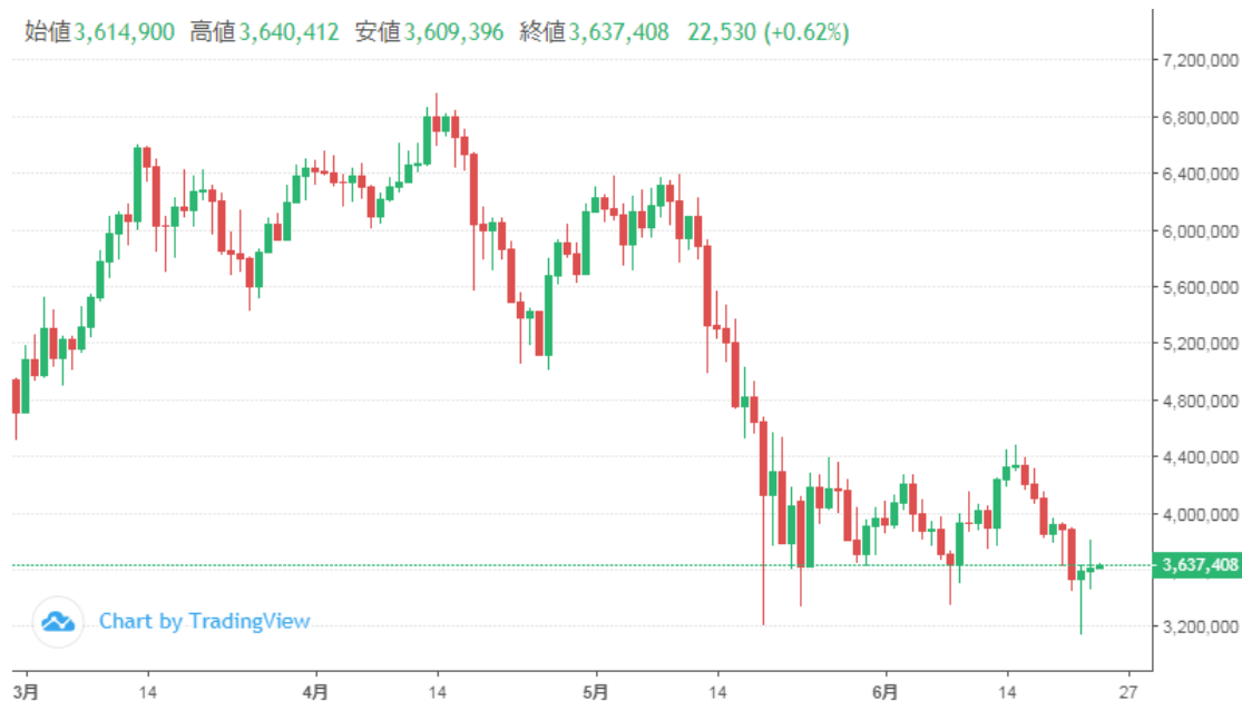
Chart by TradingView

始値 3,614,900 高値 3,640,412 安値 3,609,396 終値 3,637,408 22,530 (+0.62%)